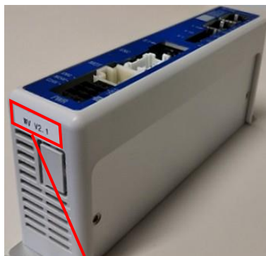
コントローラバージョン