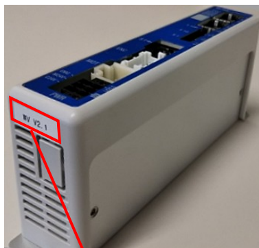
コントローラバージョン